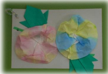
手芸・工作クラブ